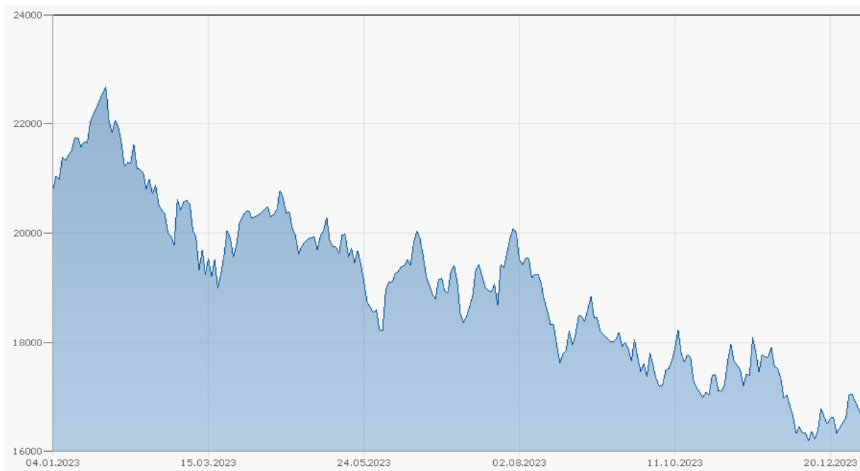
Entwicklung des Hang Seng Index seit 2021